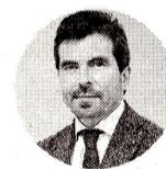
Orlando Velandia Presidente de la Agencia Nacional de Hidrocarburos

Ante el anuncio de las reservas de gas en Sirius, Frank Pearl , presidente de la Asociación Colombiana del Petróleo y Gas, ACP , comentó que: "en mayo pasado dimos el informe de cuáles son las reservas que tiene el país, que son 2,3 terapies cúbicas de gas. Para que se dimensione el tamaño del anuncio, estamos hablando ahora de 6,1 terapies cúbicas de gas y hagamos una remembranza. En 1979 se anunciaron unos descubrimientos que han sostenido al país con gas más de 45 años. Este descubrimiento implica que lo que tengamos es casi que triplicar las reservas de gas".