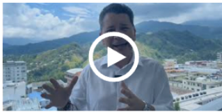
¡Es definitivo! Así quedó el valor del pasaporte en el Tolima