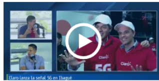
Claro lanza su señal 5G en Ibagué