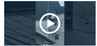
"¡Con los violentos, ni un paso atrás!": el contundente mensaje de la gobernadora Matiz