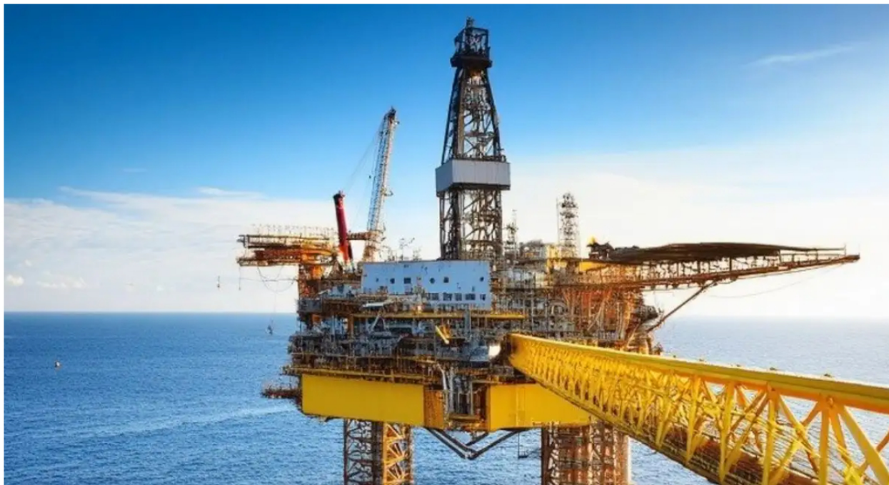
Confirman el hallazgo de gas más grande de Colombia en los últimos 30 años.

En el marco de las actividades de la exploración costa afuera que se lleva a cabo actualmente en el mar Caribe de Colombia, este jueves la Empresa Colombiana de Petróleos (Ecopetrol) y la estatal petrolera Petrobras, confirmaron el descubrimiento de un importante yacimiento de gas natural en el proyecto Sirius, anteriormente conocido como Uchuva.