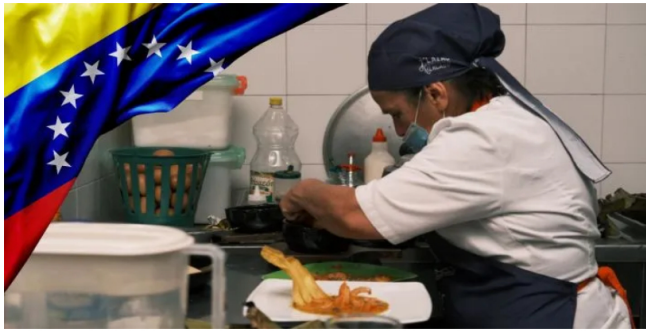
Ecopetrol revela plan de importación de gas de Venezuela.

Ecopetrol confirmó que aún contempla la opción de traer gas desde Venezuela e incluso reveló el plan bajo el cual se harían las importaciones.