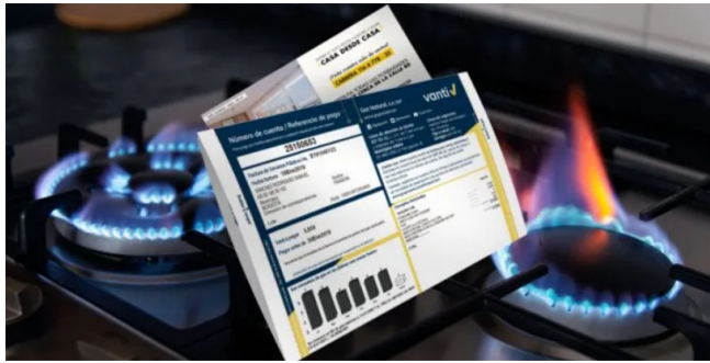
Vanti confirma que aumentará la tarifa de gas.

La empresa distribuidora de gas natural explicó que hay dos motivos por los que la tarifa del servicio aumentará en los próximos meses.