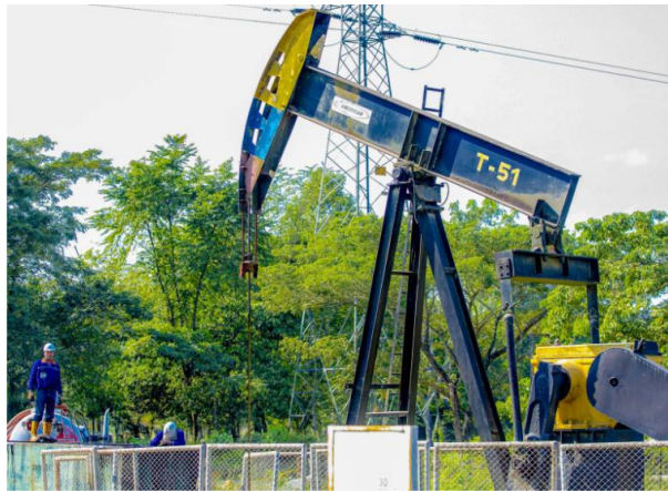
La acción de Ecopetrol alcanzó esta mañana los $1,940.

La acción alcanzó los $1,940, una recuperación de 2,37% frente al cierre del martes. La situación que se vive en el Medio Oriente ha puesto en alerta mundial al mercado del crudo.