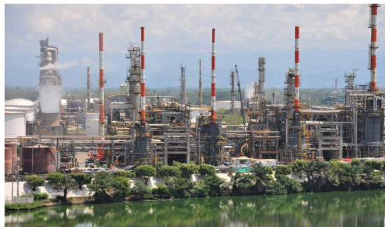
Ecopetrol y su producción de combustibles.

Ecopetrol también está atento a la pronta resolución del juez laboral sobre la suspensión de actividades de perforación en el pozo offshore Sirius, en colaboración con Petrobras, un tema de gran interés nacional debido al potencial de reservas de gas en este activo.