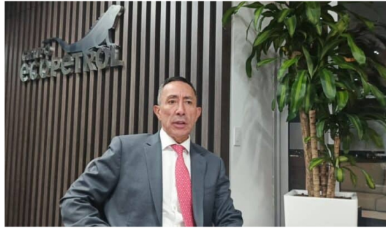
presidente de Ecopetrol Ricardo Roa.