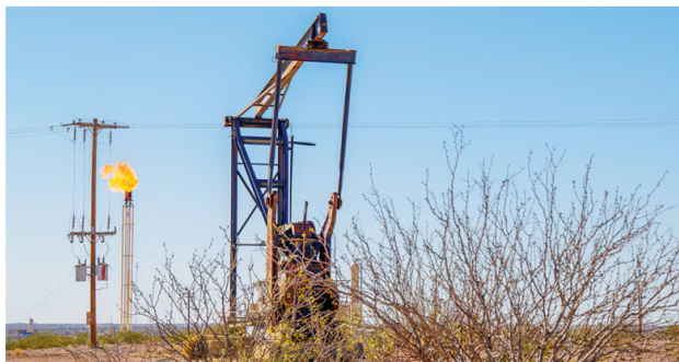
Ecopetrol aseguró en su comunicado que actualmente está atenta a la pronta resolución del juez laboral sobre la suspensión de actividades de perforación en el pozo offshore Sirius.

Finalmente, Ecopetrol aseguró en su comunicado que actualmente está atenta a la pronta resolución del juez laboral sobre la suspensión de actividades de perforación en el pozo offshore Sirius, en colaboración con Petrobras. Dicho tema es de gran interés nacional, debido al potencial elevado de reservas de gas en este activo.