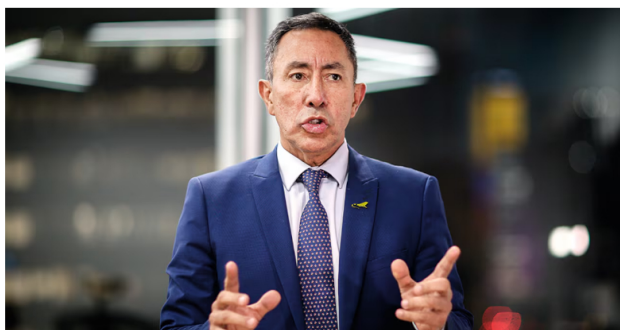
Esta medida busca que el precio del diésel se ajuste al precio internacional y flote en consonancia con este que entró en vigencia el pasado 3 de agosto.

Para el último trimestre del año, se anticipa un pago de 2,8 billones de pesos en subsidios aplicados en 2023. Cabe recordar que el 18 de junio de 2024, el Ministerio de Hacienda y Crédito Público decretó un ajuste en el precio del ACPM para grandes consumidores, aquellos que demandan más de 20.000 galones al mes. Esta medida busca que el precio del diésel se ajuste al precio internacional y flote en consonancia con este que entró en vigencia el pasado 3 de agosto.