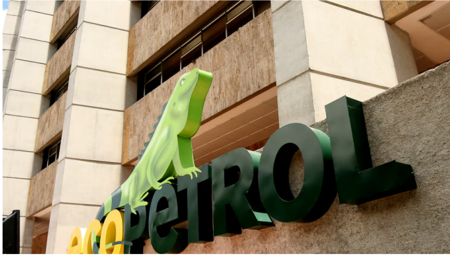
ECOPETROL FACHADA BOGOTÁ AGOSTO 17 / 2007

Ecopetrol ha enfrentado una difícil situación desde hace algunos meses, tras registrar caídas importantes en las utilidades y en el precio de su acción en el mercado, además de una reducción en la producción y otros efectos que han tenido las decisiones que ha tomado el Gobierno, que es el principal propietario de la compañía, con un 88 % de participación .