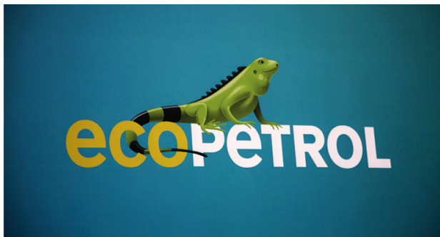
A pesar de la caída en sus ingresos y utilidades para 2023, Ecopetrol es de lejos la principal y más importante empresa colombiana.

Son varias las advertencias que se han hecho desde los diferentes gremios, pues una de las decisiones que más golpeó a esas empresas fue la de cortar de tajo la exploración y explotación de petróleo y gas y la firma de nuevos contratos de este tipo. Con ello, las reservas presentes en el país se han reducido a una mayor velocidad.