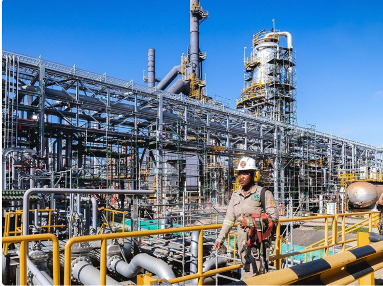
Los recursos fueron autorizados por la Junta Directiva de la empresa y están previstos dentro del plan de inversiones 2024-2026.