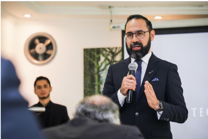
Fotografía de archivo de Andrés Camacho Morales, ministro de Minas y Energía.

El ministro Camacho también se refirió a la preocupación que hay por un posible desabastecimiento de gas en el país para el próximo año y señaló que para garantizar el servicio también tienen en la mira a compañías que solicitan una mayor cantidad del hidrocarburo del que requieren, informaron en la emisora La FM Radio .