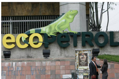
Ecopetrol invertirá US$1.000 millones para mejorar reservas de crudo

Estos recursos están destinados en el plan de Inversiones en el bienio 2024-2026, según se explicó en un comunicado.