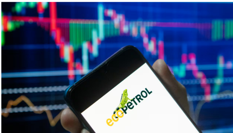
Ecopetrol hará inversiones por US$1.000 millones.

1 de octubre de 2024 Por: Redacción El País