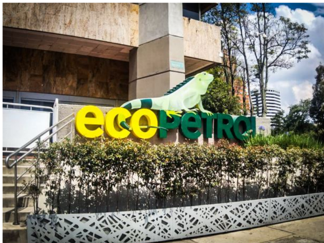
ECOPETROL dispone de volúmenes de gas que serán comercializados en su totalidad.

Según la empresa, esperan regulación para flexibilizar las transacciones entre agentes