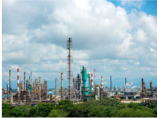
Refinería de Barrancabermeja, Colombia.

La exploración y explotación se efectuará en aguas del mar caribe y en la plataforma continental