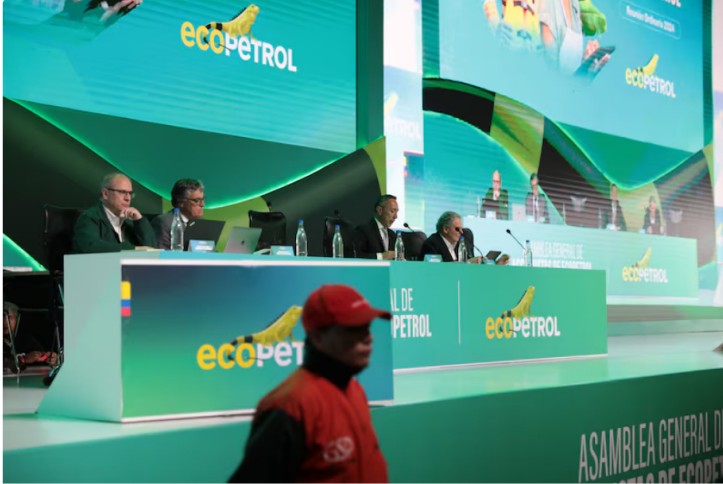
La Estrategia del Día: Ecopetrol, tasa BanRep, Leonardo Villar, desempleo y precios de energía

Hoy hablaremos sobre la decisión de la Junta de Ecopetrol, la reducción de la tasa de interés del Emisor, la continuidad de Leonardo Villar, el desempleo y los precios de la energía