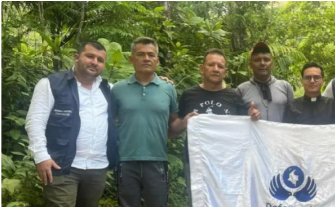
Liberación de secuestrados de Ecopetrol en el Catatumbo

Luego de más de un mes en cautiverio, tres contratistas vinculados a Ecopetrol recuperaron su libertad tras haber sido secuestrados por el Ejército de Liberación Nacional (ELN) en el Catatumbo, Norte de Santander.