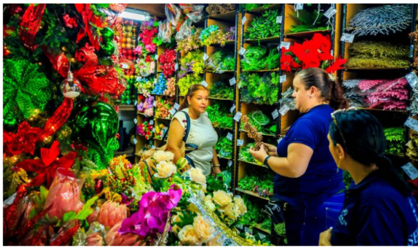
Entre agosto y octubre el comercio ocupó a 406.000 personas en el Valle de Aburrá, según el Dane.