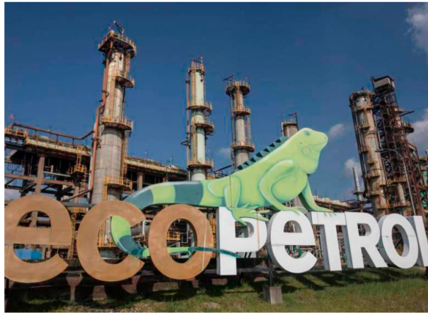
Para lograr el objetivo de una participación de 90% del Gobierno en la petrolera, las acciones a recomprar estarían limitadas a un máximo de 689 millones.

A los precios actuales de $1.790 por acción de Ecopetrol, la recompra equivaldría a $1,2 billones, para una participación de 90% del Gobierno.