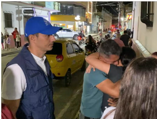
Contratistas liberados Catatumbo

Ayer liberaron tres de ellos y uno sigue en cautiverio