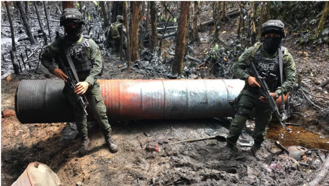
El Ejército realizó un operativo durante meses, en el que logró identificar que los delincuentes utilizaban válvulas ilegales instaladas en los poliductos Salgar-Mansilla y Mansilla-Puente Aranda. (Foto ilustración)