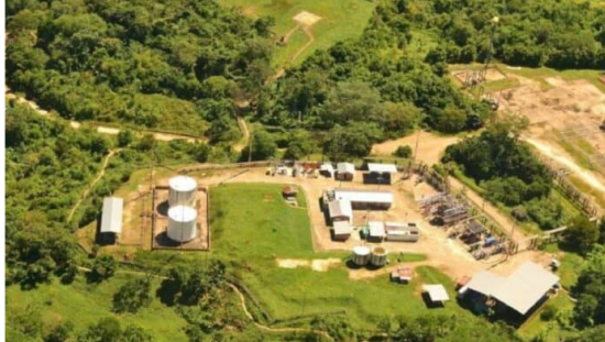
Ecopetrol advierte posibles restricciones de gas debido a toma de la planta de Gibraltar.

Este domingo, 24 de noviembre, la petrolera estatal, Ecopetrol, informó la suspensión de la operación en la planta Gibraltar debido a una toma por parte de miembros del Movimiento Político de Masas Social y Popular del Centro Oriente de Colombia (Mpmspcoc).