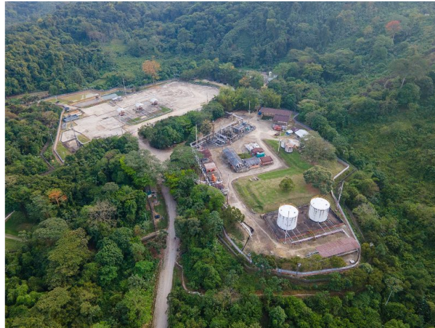
Planta de Gibraltar, ubicada en la zona rural del municipio de Toledo, Norte de Santander.