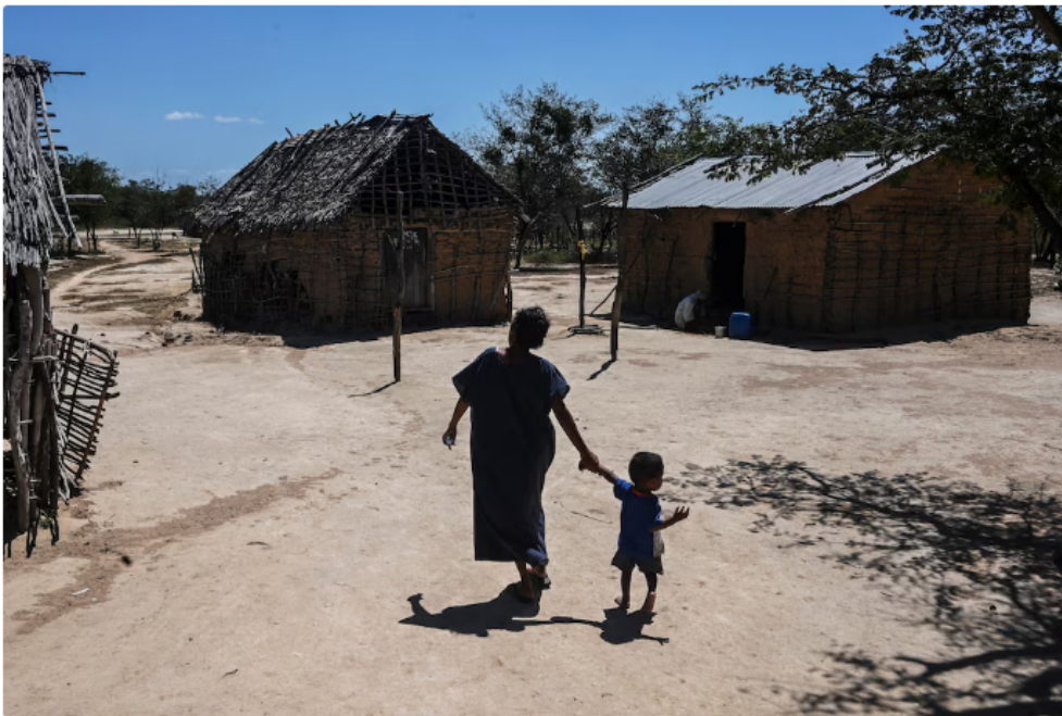
Indigenas Wayuú | (Photo by JOAQUIN SARMIENTO / AFP)

El impacto de este plan será revisado cada seis meses por un equipo especial encargado de evaluar si las medidas están dando resultados reales. Este equipo presentará informes detallados sobre lo que se está haciendo para mejorar las condiciones de vida de esta población infantil.