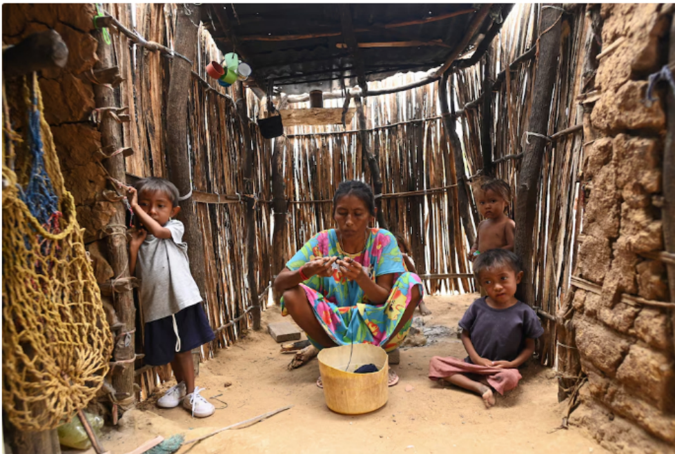
Indígenas Wayuú | (Photo by JOAQUIN SARMIENTO / AFP)

La Corte Constitucional aprobó un plan presentado por el Gobierno Nacional para atender la grave situación de los niños y niñas Wayúu en La Guajira, de acuerdo con documentación obtenida por la emisora colombiana W Radio .