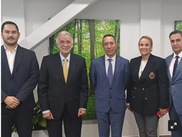
Ecopetrol estudia la posibilidad de ser el socio estratégico de la empresa.

La petrolera estudia la posibilidad de ser socio estratégico de la que será la nueva empresa de energía de la Costa.