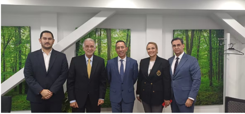
Ecopetrol se convertiría en socio estratégico de la Gestora Energética del Caribe.

5. El centro comercial más grande de la Costa iniciará construcción en 2025