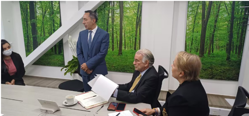
Ecopetrol se convertiría en socio estratégico de la Gestora Energética del Caribe.