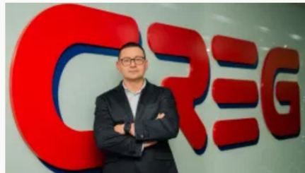
"Colombia supera estado de riesgo energético": Creg