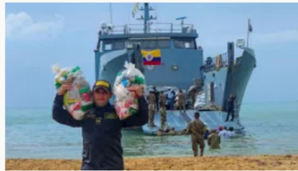
Armada llega a la Alta Guajira con las primeras ayudas humanitarias