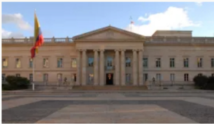
Ministros que renunciarían para aspirar a la presidencia en 2026