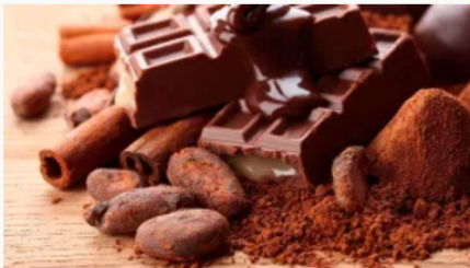
Exportaciones de chocolate colombiano se duplican en 2024