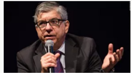
Cesar Gaviria responde a acusaciones de Gustavo Petro: "enfóquese en resolver los problemas del país"