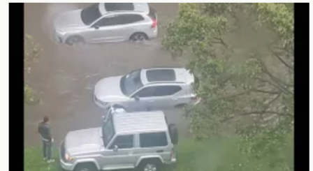
Caos en Bogotá por fuertes lluvias: vías inundadas y desbordamientos