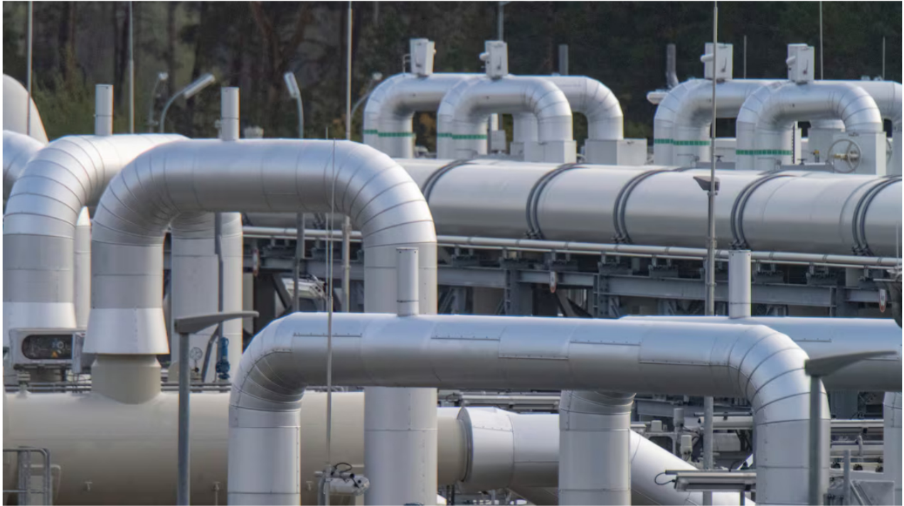
Tuberías de gas. Foto de referencia.