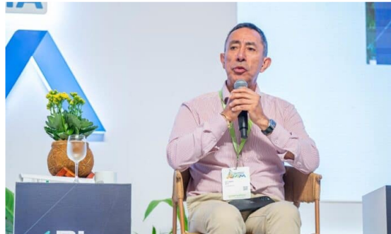
La propuesta con la que el Gobierno Petro podría aumentar su control en Ecopetrol.