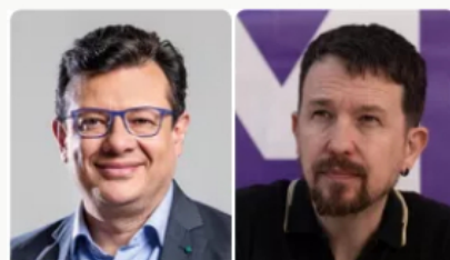
Controversia por retransmisión de programa progresista español a través de RTVC