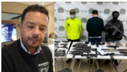
Lavado de activos en Colombia desbordado: red camufla $72.697 millones de narco alías 'Falcón'