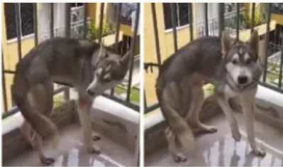
Perrito Husky, maltratado con un tazer, no aparece: denuncian que fue devuelto a su maltratador