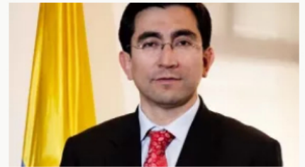
Diego Molano Aponte nuevo presidente de la ETB