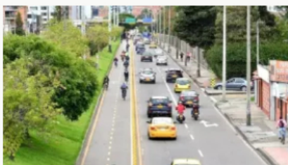
Pico y placa en Bogotá: ¿quiénes pueden circular este lunes 18 de noviembre?