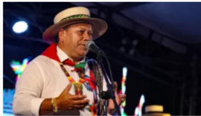
Director de la Unidad de Restitución de Tierras pide protección tras ataque incendiario a su vivienda