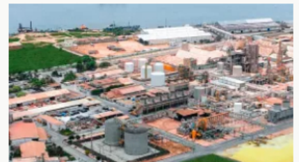
Inspección de Supersociedades a Monómeros Colombo Venezolanos por venta de acciones e insolvencia