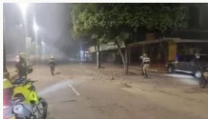
Atentado en Neiva: lanzan explosivo contra asadero Las Vegas