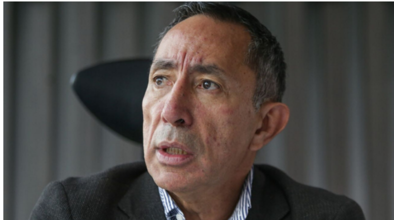
El presidente de Ecopetrol , Ricardo Roa, niega rotundamente la injerencia de su pareja en la compañía.

Publicado: Lunes, Noviembre 18, 2024 - 17:38 | Actualizado: Lunes, Noviembre 18, 2024 - 17:39