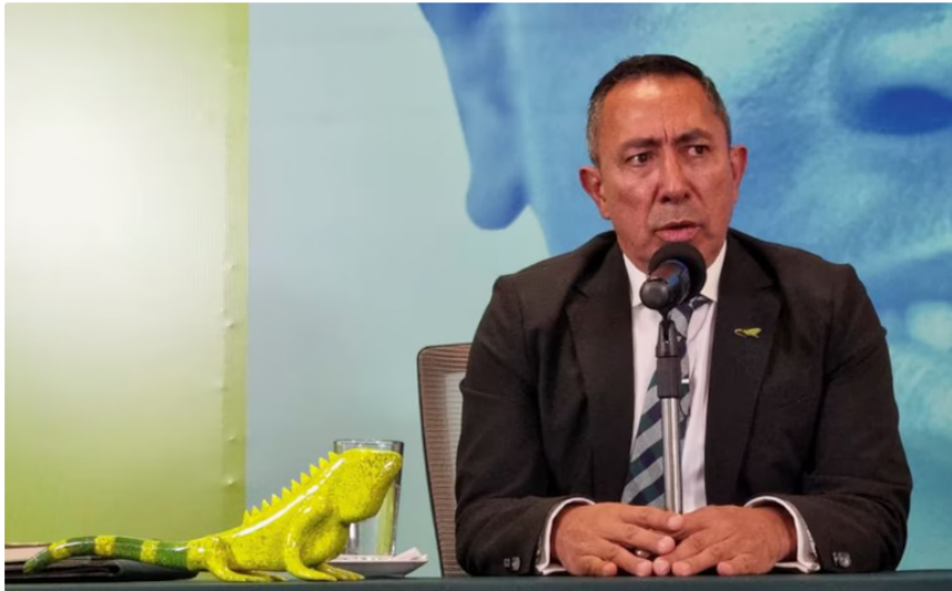
La pareja del presidente de la petrolera tendría influencia en las decisiones de la compañía