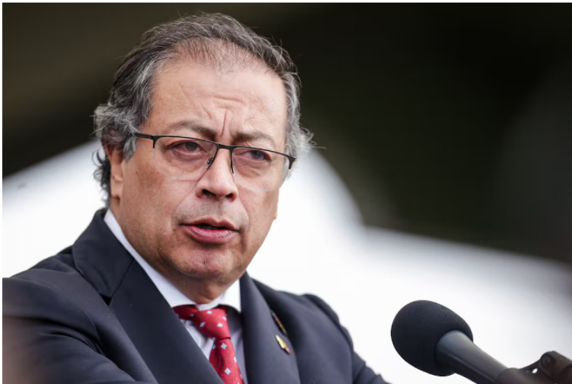
El presidente de la república, Gustavo Petro.