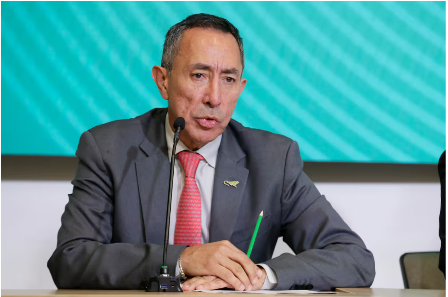
Presidente de Ecopetrol , Ricardo Roa.

El presidente de Ecopetrol habló sobre los escándalos que lo han rodeado desde que asumió el cargo en la compañía.