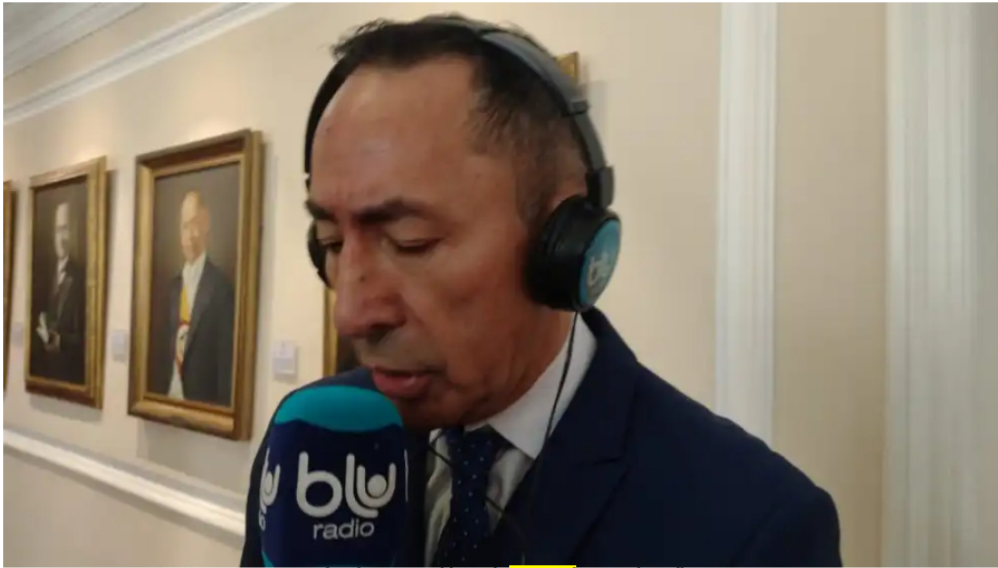
Ricardo Roa, presidente de Ecopetrol .

El presidente de Ecopetrol se defendió frente a varias acusaciones realizadas sobre el proceso de contratación, supuesta injerencia de su pareja en toma de decisiones administrativas.