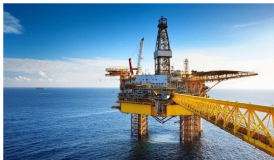
El proyecto Sirius (Uchuva) es operado por las compañías Ecopetrol y Petrobras.

Este déficit, según el experto, será inevitablemente cubierto mediante importaciones, necesarias tanto para el sector térmico como para usos esenciales como el consumo domiciliario, vehicular y comercial.