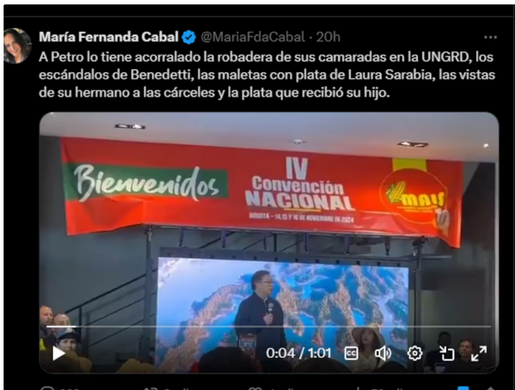
María Fernanda Cabal se despachó contra Petro por su gestión de Gobierno