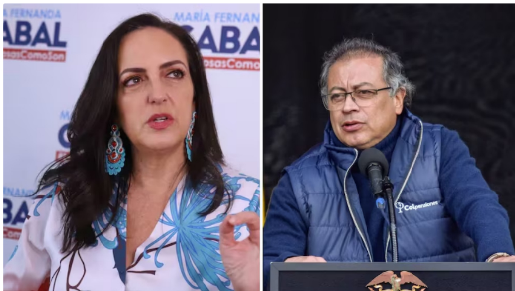
La senadora cuestionó los escándalos en los que han estado involucrados personas cercanas al presidente Petro

El presidente de la República, Gustavo Petro, estuvo en la Convención Nacional del Movimiento Alternativo y Social Indígena (MAIS) en la que habló de la importancia de las elecciones presidenciales de 2026 para el futuro de su proyecto político y el destino del país.