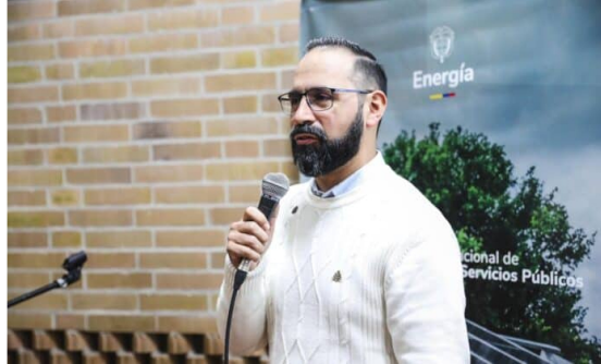
Ministro de Minas y Energía, Andrés Camacho.

El Ministerio de Minas y Energía publicó para comentarios un borrador de decreto que tiene las reglas para comercialización de gas importado, gas costa fuera y además habilita la reconversión de infraestructura a gasoductos.