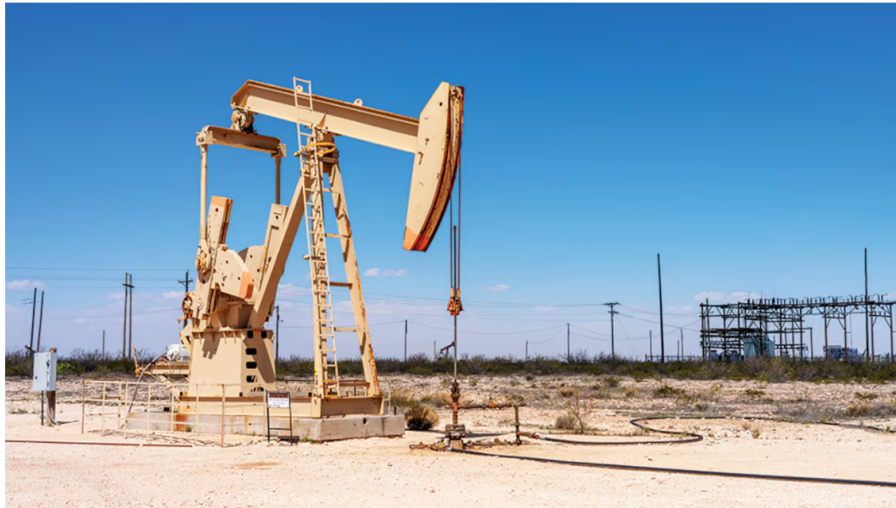
La negativa de Ecopetrol, por injerencia del Gobierno, a participar en un valioso proyecto de fracking en el Permian, en Estados Unidos, todavía retumba en el manejo del gobierno corporativo de la firma.

El 15 de marzo de 2020, en plena pandemia, el precio de la acción de Ecopetrol llegó a los 1.485 pesos, la cifra más baja de los últimos años. Luego, inició un rally de crecimiento que la llevó a techos cercanos a los 3.600 pesos en 2022, y posteriormente tuvo un ajuste que la ubicó alrededor de los 2.500 pesos. Pero desde mediados de este año la tendencia en la cotización de la acción ha sido a la baja, despertando preocupación por la pérdida de valor.