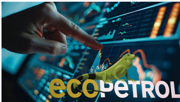
De acuerdo con la compañía, la utilidad neta en el tercer trimestre fue de 3,6 billones de pesos, una caída de 28,3 por ciento frente al mismo periodo del año anterior.

De acuerdo con cálculos de Corficolombiana, para el 14 de noviembre, la acción de Ecopetrol cerró a 1.750 pesos y su capitalización bursátil se ubicó en 71,95 billones de pesos. En ese sentido, la firma estimó para SEMANA el impacto de la destorcida en tres escenarios. El primero, desde cuando empezó la caída más reciente de la acción, el pasado 18 de junio, hasta estos días: la contracción en su valor fue de 26,2 por ciento, un declive de 25,5 billones de pesos. El segundo, en el año corrido, y esa disminución ha sido de 25,2 por ciento, una pérdida en su capitalización de 24,3 billones. Y el tercero, en los últimos 12 meses, con una pérdida de 28,6 billones de pesos por un descenso del 28,4 por ciento.