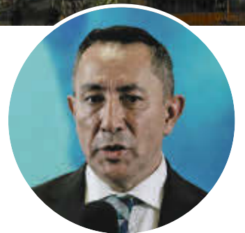
RICARDO ROA Presidente de Ecopetrol

Estos datos negativos contrastaron con el positivismo que mostró Ricardo Roa, presidente de Ecopetrol, en la rueda de prensa de presentación ayer de resultados, cuando destacó que se lograron ingresos por $98,5 billones en los primeros nueve meses del 2024, un EBITDA (beneficio antes de restar los intereses, impuestos, depreciaciones y