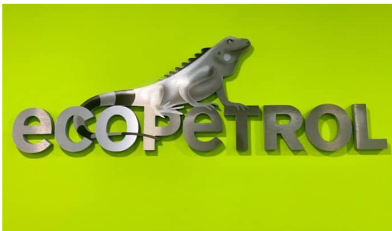
Ecopetrol avanza en los proyectos Sirius y Komodo 1.

Ecopetrol tiene dos ambiciosos proyectos en la mira para obtener gas, se trata de Sirius o también conocido como Uchuva -2 y Komodo 1.