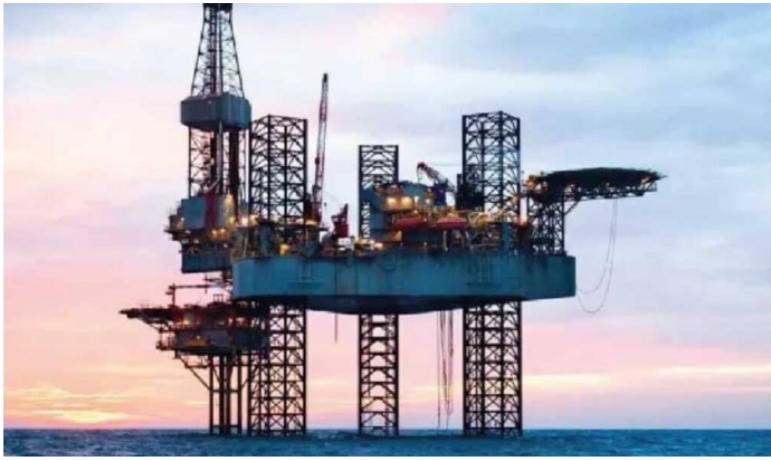
Ecopetrol avanza en los proyectos Sirius y Komodo 1.