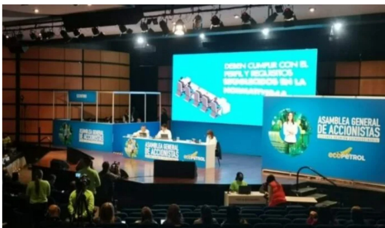
Ecopetrol tendrá su Asamblea General de Accionistas de 2025 en marzo.

A pesar de tener unos billonarios niveles de caja al cierre del tercer trimestre, Ecopetrol les recomendará a sus accionistas no entregar un dividendo extraordinario en 2025.