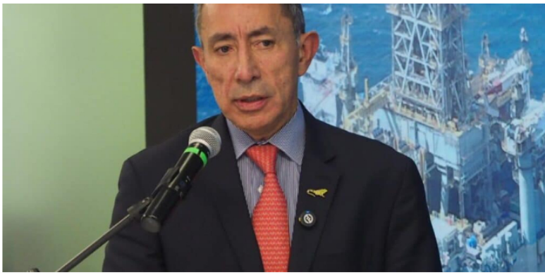
Según Ricardo Roa, presidente de Ecopetrol , la entrega de dividendos extraordinarios dependerá exclusivamente de la Asamblea de Accionistas.

En este reporte, Ecopetrol también confirmó que logró más de $18 billones en caja y podría lograr una cifra todavía superior al cierre de 2024.