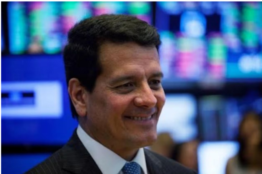
Felipe Bayón, expresidente de Ecopetrol.

La buena racha de la compañía estatal siguió en 2023 con resultados anuales de 143 billones de pesos