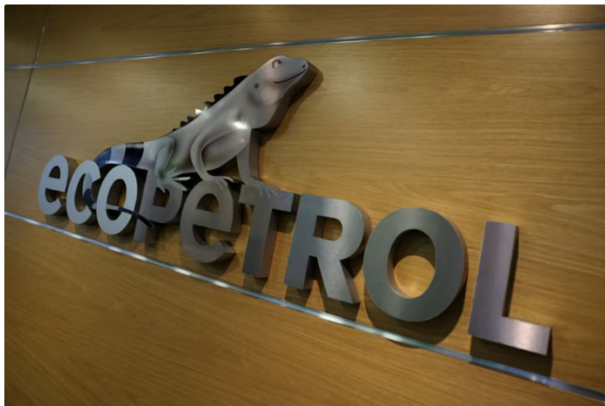
La administración de Cenit reestructuró trece gerencias tras las investigaciones

Un directivo de Cenit, filial de Ecopetrol , la empresa estatal encargada del transporte de petróleo en Colombia, denunció un intento de corrupción tras ser citado a una reunión sospechosa el 24 de septiembre en el lobby del Hotel NH, en Bogotá.