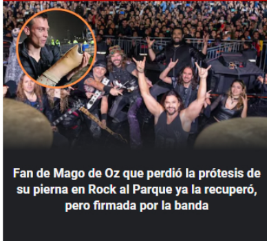
Fan de Mago de Oz que perdió la prótesis de su pierna en Rock al Parque ya la recuperó, pero firmada por la banda

Sofía de 'Betty la fea' regresó al país después de 17 años: en dónde vive y por qué se fue