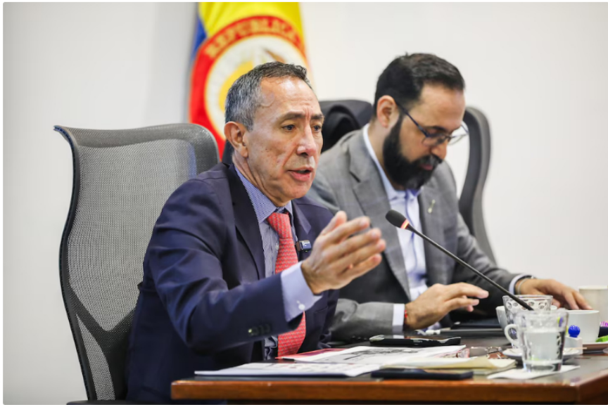
Ricardo Roa, presidente de Ecopetrol , y Andrés Camacho, ministro de Minas y Energía, principales voceros en temas de abastecimiento eléctrico y de gas

Las dificultades e insuficiencias técnicas quedaron en evidencia el pasado 16 de agosto de 2024, cuando un apagón en la planta afectó el suministro de combustible de aviación en Colombia, forzando a Ecopetrol a recurrir a importaciones para satisfacer la demanda.