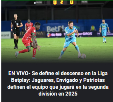
EN VIVO- Se define el descenso en la Liga Betplay: Jaguares, Envigado y Patriotas definen el equipo que jugará en la segunda división en 2025

EN VIVO - Fecha 19 de la Liga BetPlay II-2024: seis equipos aspiran por dos cupos restantes para los cuadrangulares semifinales