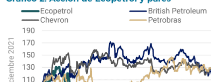
Gráfico 2. Acción de Ecopetrol y pares

Sobre todo, porque en esta reunión se podrían revelar nuevos detalles de proyecciones para finales de 2024 y el próximo año, en particular con dos puntos clave para la industria: las reservas de petróleo y gas, y las acciones para mejorar la productividad de los pozos en exploración.