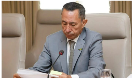
Ricardo Roa es presidente de Ecopetrol desde abril de 2023.

El mercado cree que Ecopetrol habría tenido una fuerte caída en utilidades en el tercer trimestre de este año , pero está a la expectativa de lo que revelará en la tarde la principal empresa de Colombia.