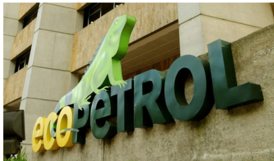
En lo corrido del año al primer semestre, las utilidades de Ecopetrol cayeron 24,2 %.

De hecho, no hay que olvidar que, durante este año, la compañía más grande de Colombia ha tenido importantes decrecimientos en sus ganancias trimestrales.