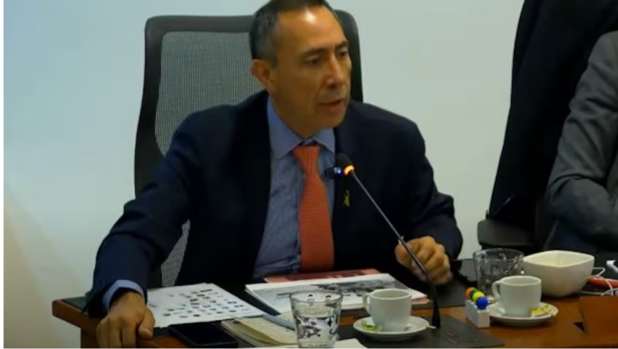
Ricardo Roa, presidente de Ecopetrol, en debate de control político en la Cámara.

Colombia tiene una única regasificadora para importar gas y se llama Spec, pero podría tener otra, según lo que anunció este miércoles 13 de noviembre, el presidente de Ecopetrol, Ricardo Roa, durante un debate de control político en el Congreso de la República.