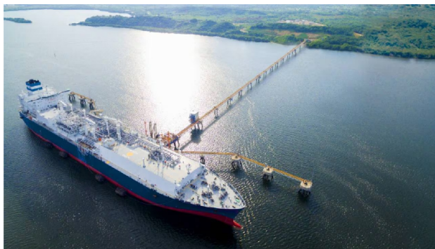
Planta de Regasificación

En la época en la que hay agua las térmicas se apagan, lo que implica que no requieren una demanda de gas adicional, como la que se tuvo recientemente, justamente para que la energía generada en las plantas térmicas (se encienden principalmente con gas), que resulta ser más costosa y contaminante, pudiera respaldar la mayoría en el país, que es la que proviene de las hidroeléctricas, las cuales, en condiciones normales (sin sequía) aportan el 70 % de la energía eléctrica que consume el país.