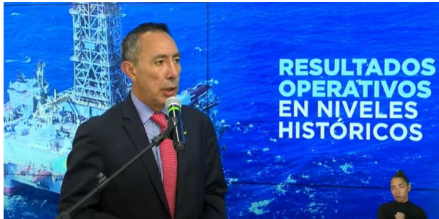
Ricardo Roa, presidente de Ecopetrol, al presentar los resultados de la petrolera.

En el tercer trimestre del 2024, el Grupo Empresarial Ecopetrol reportó una utilidad neta atribuible a accionistas de $3,6 billones, lo que implica una caída de 28,3 %, según el informe.