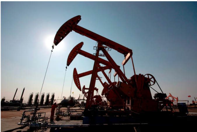
Imagen de archivo de una planta petrolífera.