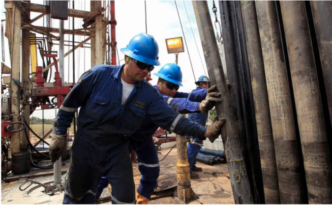
FOTO DE ARCHIVO. Empleados trabajan en una tubería de excavación de petróleo en departamento del Meta, Colombia, 23 de enero. REUTERS/José Miguel Gómez

GeoPark y Hocol, una filial del Grupo Ecopetrol, han logrado avances importantes en sus actividades de exploración y producción en los bloques petroleros de los Llanos en Colombia, de acuerdo con información obtenida por el periódico colombiano El Tiempo .