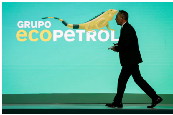
Ricardo Roa, presidente de la compañía colombiana Ecopetrol// Colprensa.

El presidente de Ecopetrol manifestó que pese a algunos resultados negativos presentados en el informe, en la línea tradicional de los hidrocarburos “suceda lo que suceda, digan lo que digan, la tendencia es al alza”. Lea también: Ecopetrol, listo para vender todo el gas que tiene disponible