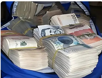
Immo | Patrocinado Una inversión en IA podría generar ingresos adicionales para ti. Ella tenía veintinueve años cuando encontró el camino para volverse millonaria.