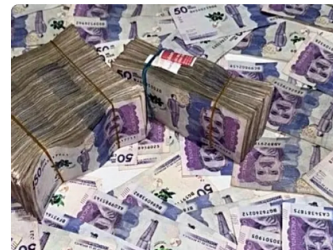
Goaly | Patrocinado Bojaca: Cambia tu vida con CFDs de ExxonMobil [Empieza ahora]