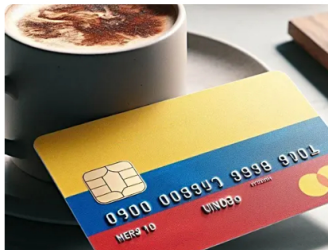
Think.G | Patrocinado Bojaca: Obtén ingresos con Amazon CFD [Ve cómo]