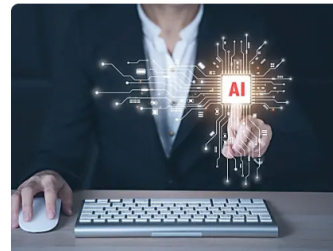
CO_NEWS | Patrocinado Bojaca: Su IA trabaja mientras descansas [Descubre cómo]