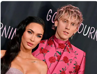
El Universal Megan Fox anuncia embarazo tras aborto espontáneo La actriz de Hollywood que había tenido hace poco más de un año un aborto espontáneo, que está en la dulce espera de su ...