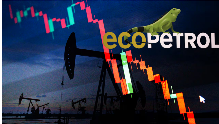
La acción de Ecopetrol ha venido en descenso en los últimos días.

13 de noviembre de 2024 Por: Redacción Economía