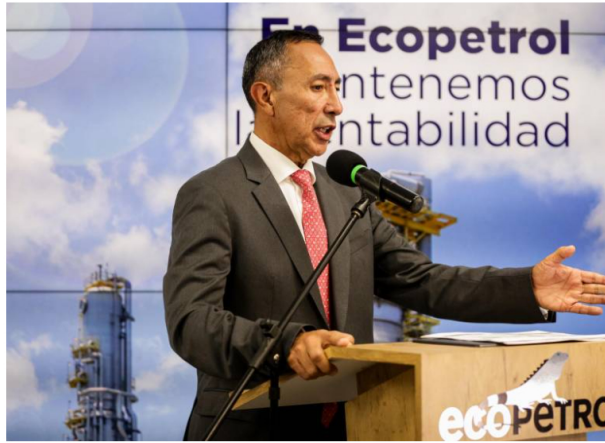
Ricardo Roa, presidente de Ecopetrol.

La petrolera colombiana sigue sin levantar cabeza en sus reportes trimestrales financieros.