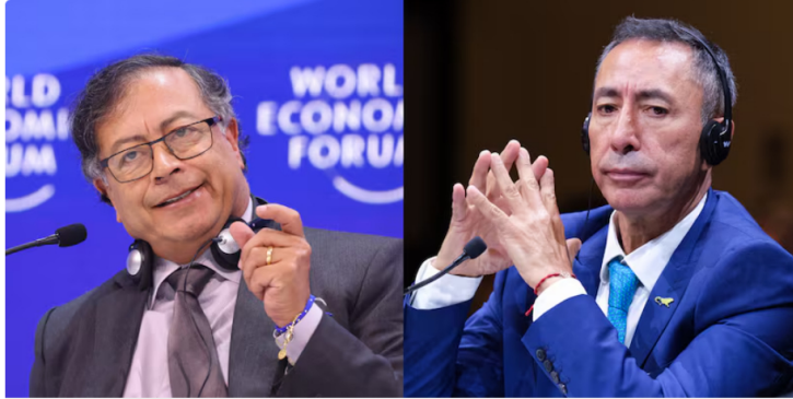
Presidente de Ecopetrol le propuso al Gobierno Petro recomprar acciones de la empresa