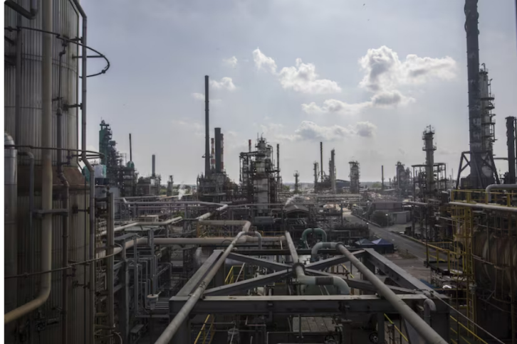
A caída de Ecopetrol en bolsa se le suma desplome de utilidades

De acuerdo con la compañía este año ha ganado 25% menos que en primeros nueve meses de 2023